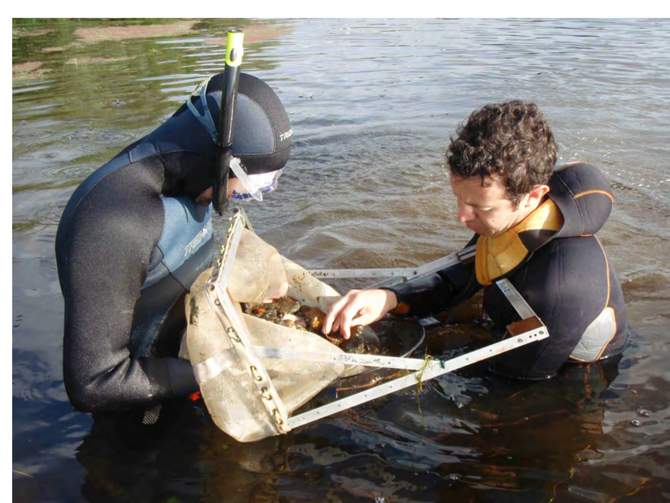
Figure 4 : Tri de sédiment lors d'un double échantillonnage.