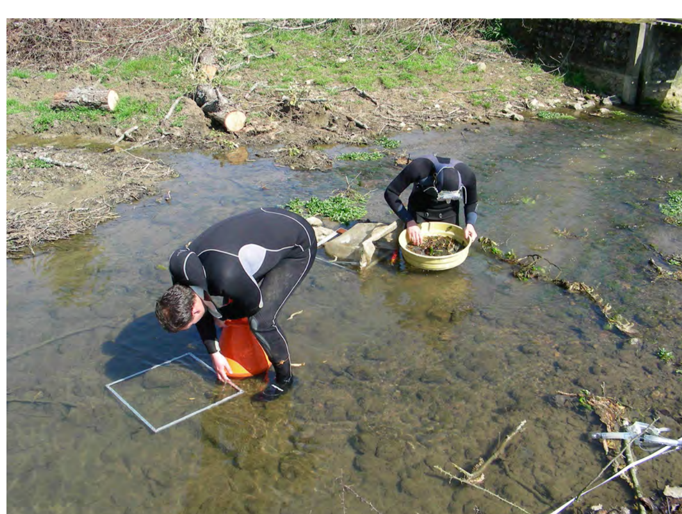
Figure 3 : Mise en œuvre d'un échantillonnage systématique avec double échantillonnage dans le Palais.