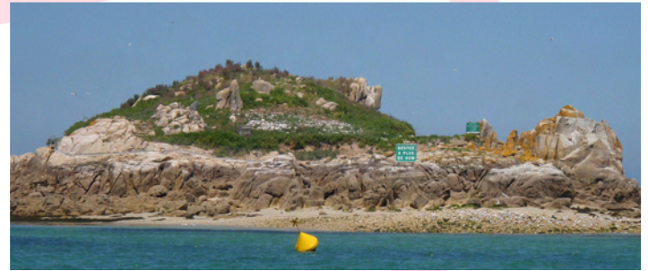
La clôture, quasi-invisible, vue du chenal entre l'île aux Dames et l'île de Sable

travail pour une clôture de 175 m de long et 1,2 m de haut. Électrifiée par un fil alimenté par un panneau solaire et agrémentée de 9 pièges à vison en son pied, elle est restée parfaitement hermétique tout au long de la saison. Grâce à elle, le nombre de sternes de Dougall qui se sont reproduites en 2009 était supérieur à nos prévisions. Cela prouve que l'île aux Dames est toujours attractive et nous espérons que la prochaine saison verra enfin les effectifs augmenter.